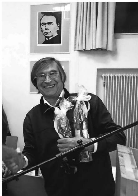
Dank an Hartmut Semmler