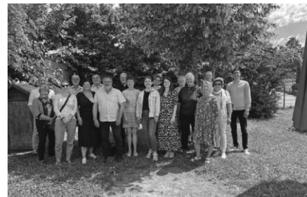
Mitglieder der Kirchengemeinderäte der SE Nord trafen sich in Berg

Das zweite große Thema ist die Kirchen- gemeinderatswahl 2025. Es ist zwar noch ein wenig hin, dennoch müssen bald die Wahlausschüsse gebildet werden, sowie Kandidatinnen und Kandidaten gefunden werden. Es ist sehr zu hoffen, dass in al- len drei Kirchengemeinden der SE ein gu- tes und arbeitsfähiges Gremium zustande kommt. Die amtierenden Kirchengemein- deräte haben sich hierzu ausgetauscht, wie man neue Personen für das Ehrenamt in der Gemeinde gewinnen kann. Ferner wurde bei dem Treffen auch über die spannenden großen Herausforderun- gen gesprochen, vor denen die Kirche Vo- rort wie auch darüber hinaus, steht.